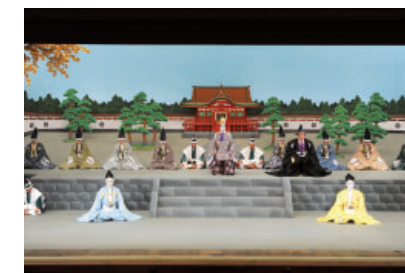
歌舞伎座平成21年11月 「仮名手本忠臣蔵・大序」