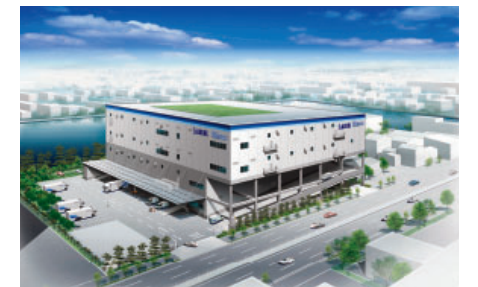
新木場の賃貸用倉庫（夏頃竣工予定）