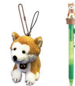
「HACHI 約束の犬」 ©Hachiko, LLC