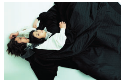
日生劇場平成21年9月 「Musical ジェーン・エア」

連結子会社の松竹衣裳㈱は、演劇・舞踊・映画・テレビ業界の貸衣裳を中心として、堅調な成績を収めました。