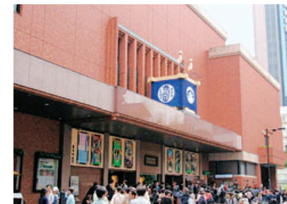
新橋演舞場 ©松竹株式会社