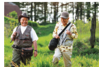
「釣りバカ日誌20ファイナル」 ©2009 松竹