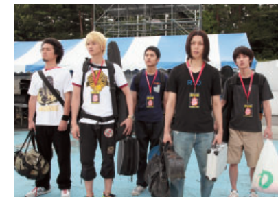
「BECK」2010年9月4日(土) 全国ロードショー

株主の皆様におかれましては、今後とも一層のご支援とご理解を賜りますようお願い申し上げます。